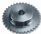
CRA6 koło zębate z 36 zębami