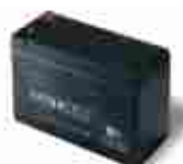
B12-B akumulator 12V 6.0 Ah