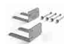
CRA8 dodatkowe uchwyty mocujące siłownik SUMO/SOON do ściany w przypadku bocznej montażu