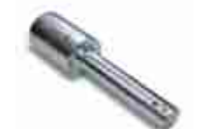
CRA9 adaptor do SUMO/SOON na wał: 1 1/4", 35mm, 40mm