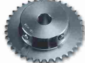
CRA6 koło zębate z 36 zębami