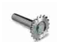
CRA1 koło zębate z 18 zębami plus wałek pośredni do SUMO/SOON