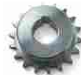
CRA7 koło zębate z 18 zębami