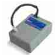
PS124 akumulator 24V 1.2 Ah z wbudowaną kartą ładowania