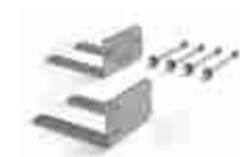
CRA8 dodatkowe uchwyty mocujące siłownik SUMO/SOON do ściany w przypadku bocznej montażu