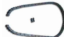
CRA4 łańcuch, 5 m plus spinka do łańcucha